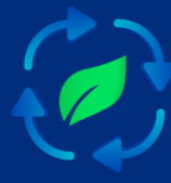
สิ่งแวดล้อม