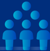
แรงงานและสิทธิมนุษยชน