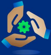
จรรยาบรรณทางธุรกิจ