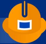
สุขภาพและความปลอดภัย